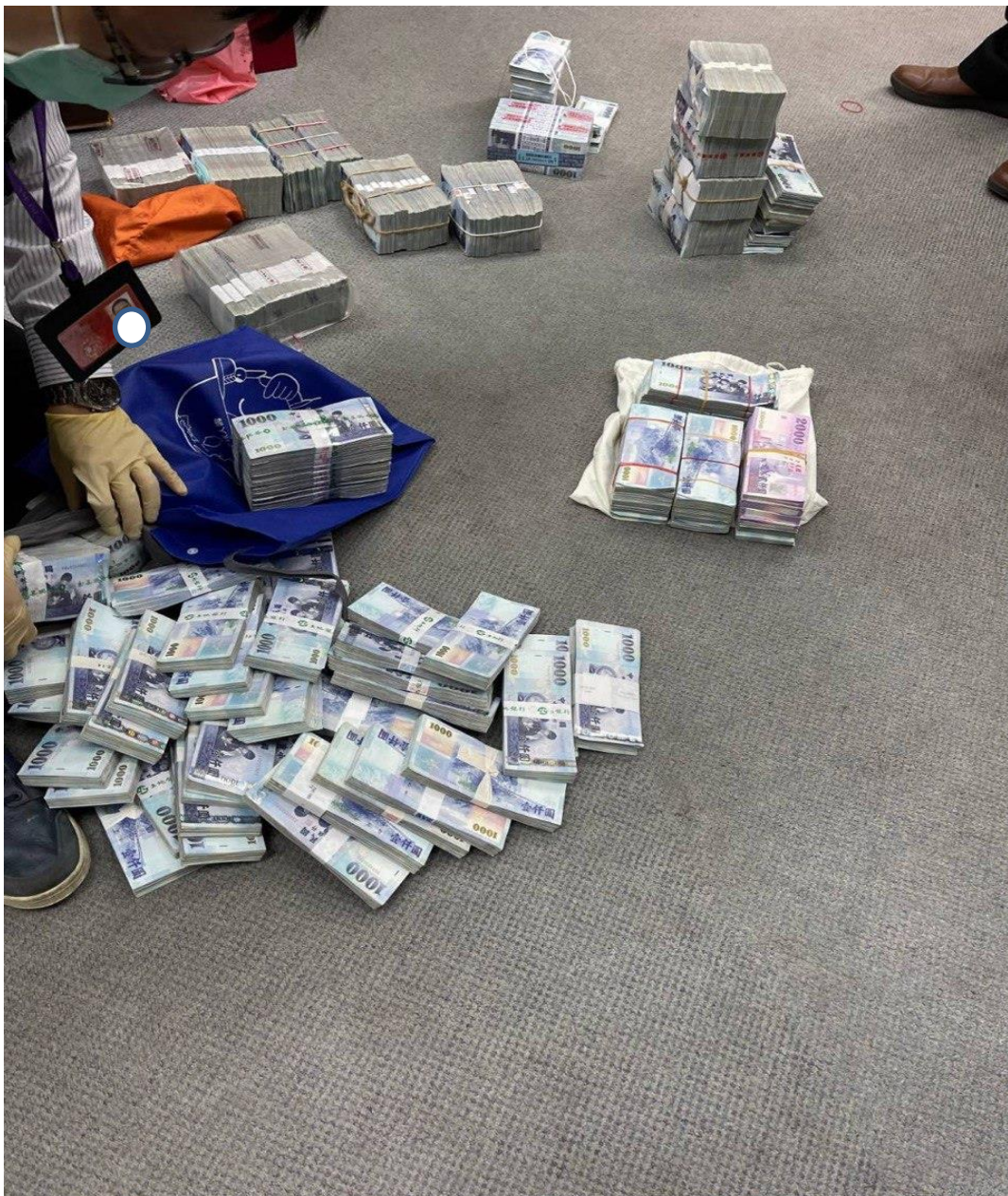
(照片 1：現場查扣現金 1)

許核准被告徐○羈押禁見、劉○○羈押，其餘被告李○○、黃○○分別諭知 80 萬元、30 萬元交保候傳。後續除由專案小組擴大偵辦外，也呼籲涉案員工及業者儘速自首，以免自誤。