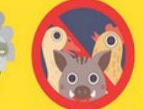
避免接觸野生 動物、禽鳥