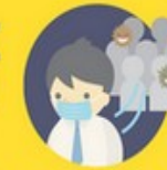
少去醫院 等人多場所